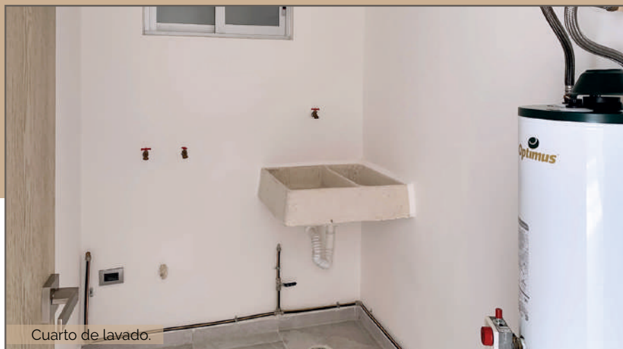
Cuarto de lavado.