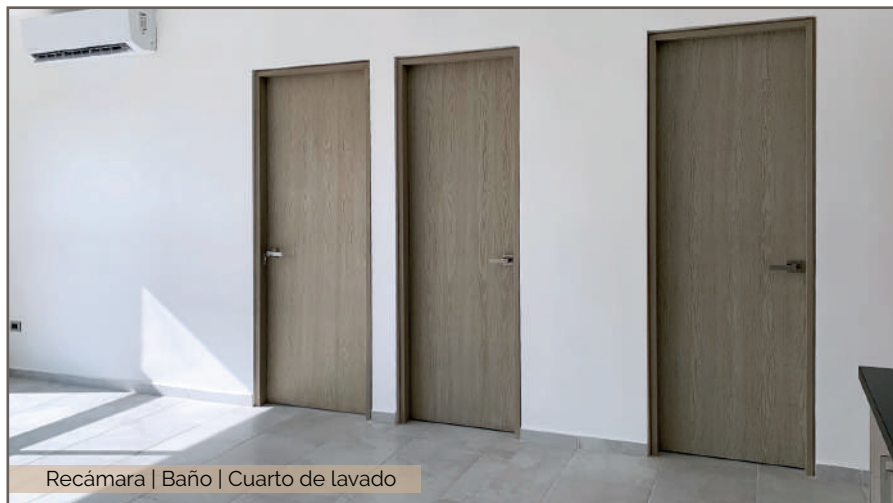
Recámara | Baño | Cuarto de lavado